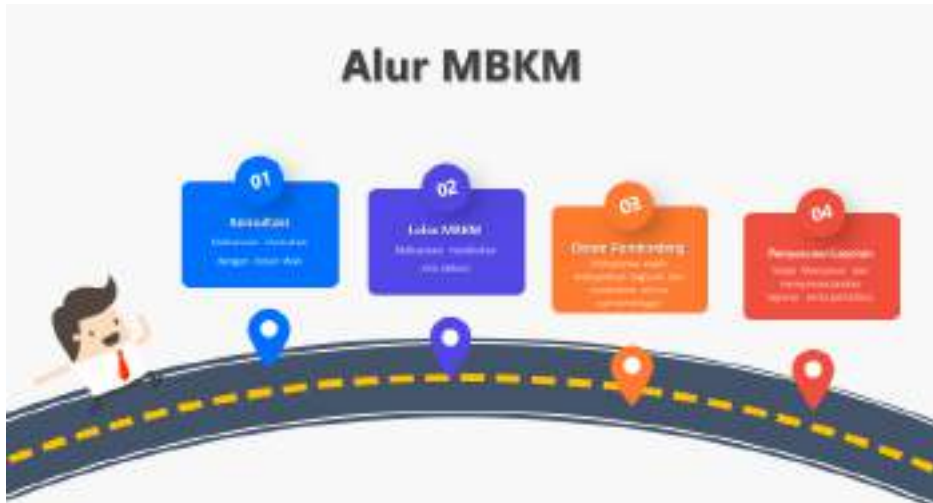
Gambar 5.3. Alur MBKM non Perkuliahan