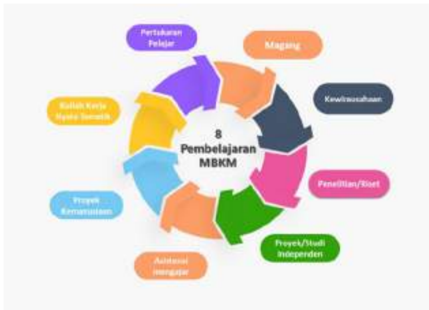
Gambar 5.1. Bentuk Kegiatan Pembelajaran MBKM