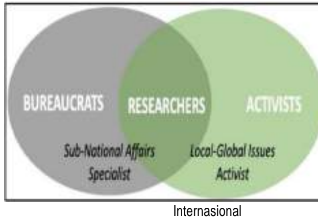
Gambar 1. Profil Lulusan Program Studi Hubungan

Deskripsi profil lulusan program studi Hubungan Internasional adalah sebagai berikut: